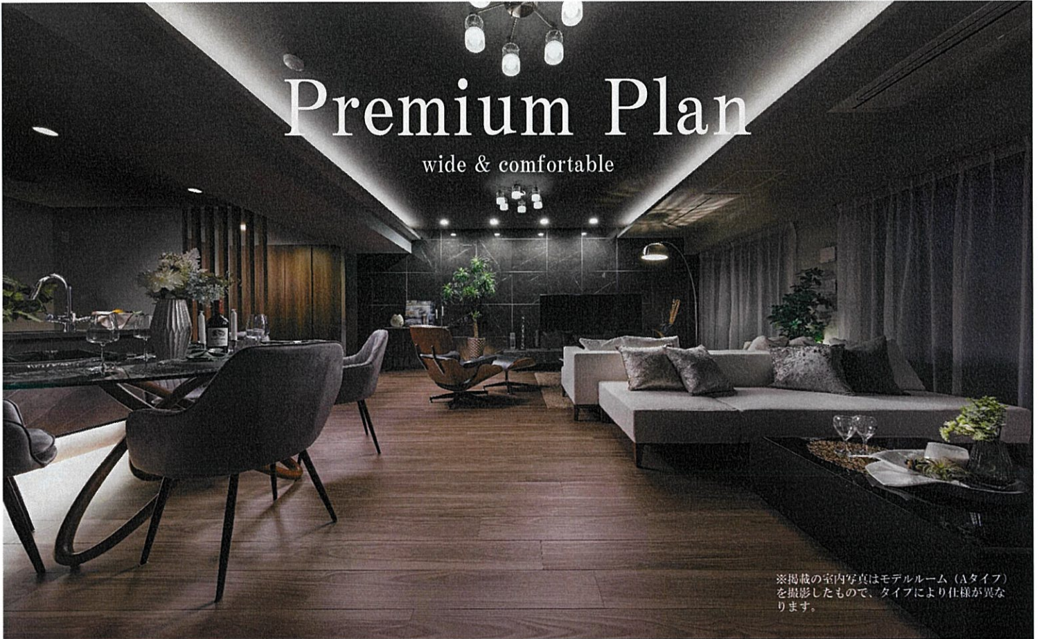
※掲載の室内写真はモデルルーム（Aタイプ）を撮影したもので、タイプにより仕様が異なります。